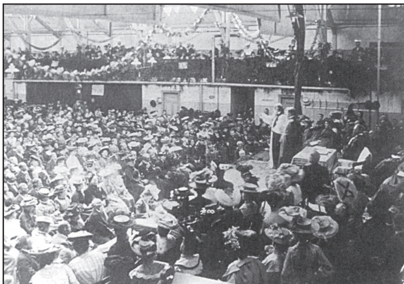
Проповедь Дауи в Австралии