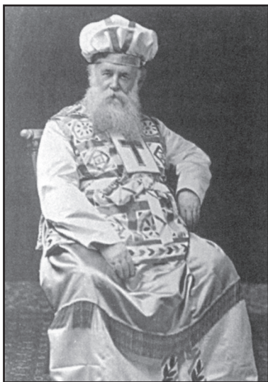
Джон Александр Дауи, Верховный градоначальник Сиона, в облачении первосвященника

Яркий и печальный пример тщетности того, что делал Дауи в этой сфере, относится ко времени его «ню-йоркского визита». Епископ